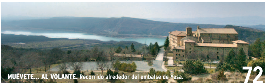
MUÉVETE... AL VOLANTE. Recorrido alrededor del embalse de Yesa.