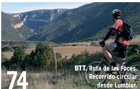
BTT. Ruta de las Foces. Recorrido circular desde Lumbier.