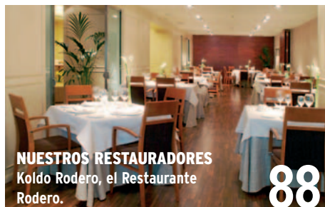
NUESTROS RESTAURADORES Koldo Rodero, el Restaurante Rodero.